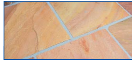
De vers gevoegde tegels worden snel gereinigd – ze zien er helder en zuiver uit.