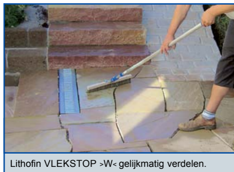
Lithofin VLEKSTOP >W< gelijkmatig verdelen.

De net geïmpregneerde tegels tijdens het oppervlakkig indrogen (de eerste 2 uur) beschermen tegen regen en vochtigheid. Gereedschap kan u met water reinigen.