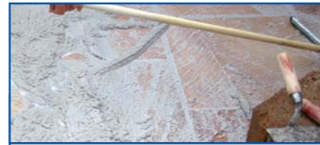
Voegwerk met epoxyhars-voegmateriaal.

Vlekken door opstijgend vocht kunnen door het rondom impregneren van de tegels verminderd worden. Voorwaarde voor een dergelijke behandeling is dat de tegels perfect droog en zuiver zijn en op een drainerende ondervloer geplaatst worden. Het impregneren van alle zijden van de tegels kan door het dompelen (ca. 30 seconden) of het instrijken met een rol of kwast. Productresten die niet worden opgenomen door het materiaal moeten voor het opdrogen afgeveegd worden. Voor het plaatsen oppervlakkig laten drogen : bij plaatsing met een natte impregnering op de tegel kan er een verzwakking ontstaan van de werking.