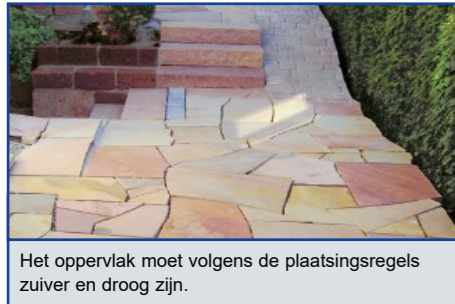
Het oppervlak moet volgens de plaatsingsregels zuiver en droog zijn.