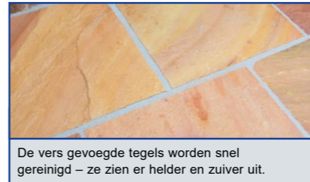
De vers gevoegde tegels worden snel gereinigd – ze zien er helder en zuiver uit.