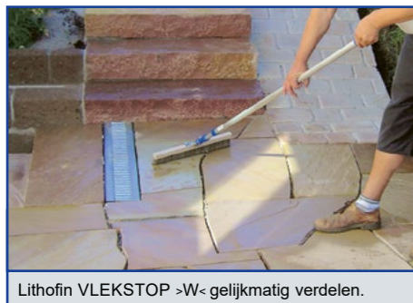
Lithofin VLEKSTOP >W< gelijkmatig verdelen.

De net geïmpregneerde tegels tijdens het oppervlakkig indrogen (de eerste 2 uur) beschermen tegen regen en vochtigheid. Gereedschap kan u met water reinigen.