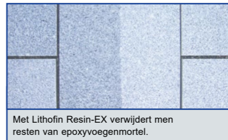
Met Lithofin Resin-EX verwijdert men resten van epoxyvoegmateriaal.