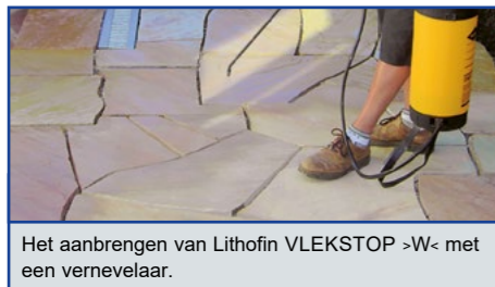
Het aanbrengen van Lithofin VLEKSTOP >W< met een vernevelaar.

Het natuur- of betonsteenoppervlak moet volgens de algemene plaatsingsregels geplaatst en gelegd zijn. Bij een voegwerk met drainerende functie is een aangepaste afwaterende ondergrond noodzakelijk. Volg steeds de richtlijnen van de voegmortel fabrikanten. De tegels moeten zuiver, vlek-vrij en droog zijn. De oppervlakte-temperatuur moet 10 - 25°C bedragen, max 30°C. Nooit producten verwerken bij warm weer in volle zon.