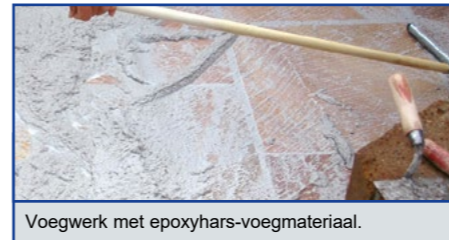
Voegwerk met epoxyhars-voegmateriaal.

Vlekken door opstijgend vocht kunnen door het rondom impregneren van de tegels verminderd worden. Voorwaarde voor een dergelijke behandeling is dat de tegels perfect droog en zuiver zijn en op een drainerende ondervloer geplaatst worden. Het impregneren van alle zijden van de tegels kan door het dompelen (ca. 30 seconden) of het instrijken met een rol of kwast. Productresten die niet worden opgenomen door het materiaal moeten voor het opdrogen afgeveegd worden. Voor het plaatsen oppervlakkig laten drogen : bij plaatsing met een natte impregnering op de tegel kan er een verzwakking ontstaan van de werking.